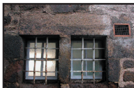
Une des réalisations d'Anaïs.

En septembre 2004 les étudiants de première année du DUT SRC du Puy en Velay ont effectué une exposition virtuelle de photographies sur le thème de l'ouverture. (Vous pouvez retrouver cette exposition sur le site ci-dessus dans la rubrique actualité).