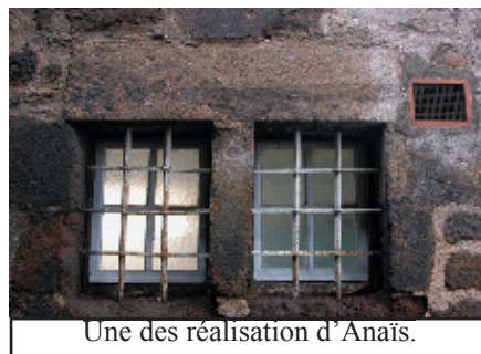
Une des réalisations d'Anaïs.

En septembre 2004 les étudiants de première année du DUT SRC du Puy en Velay ont effectué une exposition virtuelle de photographies sur le thème de l'ouverture. (Vous pouvez retrouver cette exposition sur le site ci-dessus dans la rubrique actualité).